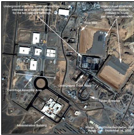
Figur 3 Satellitenbild der Anlage zur Uran-Anreicherung von Natanz.