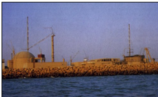
Figur 4 Baustelle des Reaktors in Bushehr.

Bushehr Der 1'000 MWe Druckwasser-Reaktor russischer Bauart VVER-1000 wird vermutlich 2005 und nicht wie ursprünglich geplant im Juni 2004 den Betrieb aufnehmen. Iran wollte bisher die Brennstäbe (mit russischer Unterstützung) selber wieder aufbereiten. Russland möchte nun auf Druck der USA die Brennstäbe nur unter der Bedingung liefern, dass Iran diese nach dem Einsatz im Reaktor wieder zurückgibt. Es ist zudem möglich, dass Russland die Lieferung der Brennstäbe verzögerte, um Iran zur Unterzeichnung der Zusatzprotokolle zu bewegen.