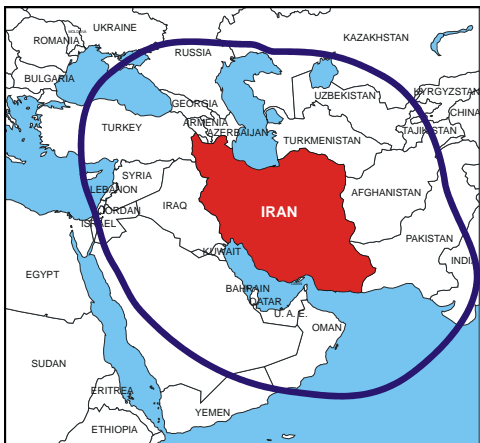
Figur 5 Die blaue Kurve umrandet das Gebiet, welches mit einer iranischen Rakete von 1'000 km Reichweite getroffen werden könnte.

Es ist mithin offensichtlich, dass ein starker Zusammenhang zwischen Raketenprogrammen und militärischen Nuklearprogrammen existiert. Ein ernst zu nehmendes Raketenprogramm ist ein wichtiger Indikator für ein militärisches Nuklearprogramm.