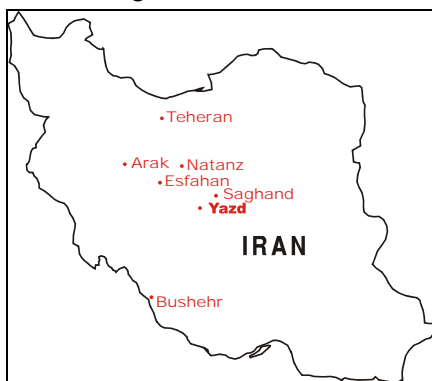
Figur 2 Karte Irans mit den Orten der wichtigsten Nuklearanlagen.

Iran verfügt an verschiedenen Standorten über grössere nukleare Anlagen (Figur 2).