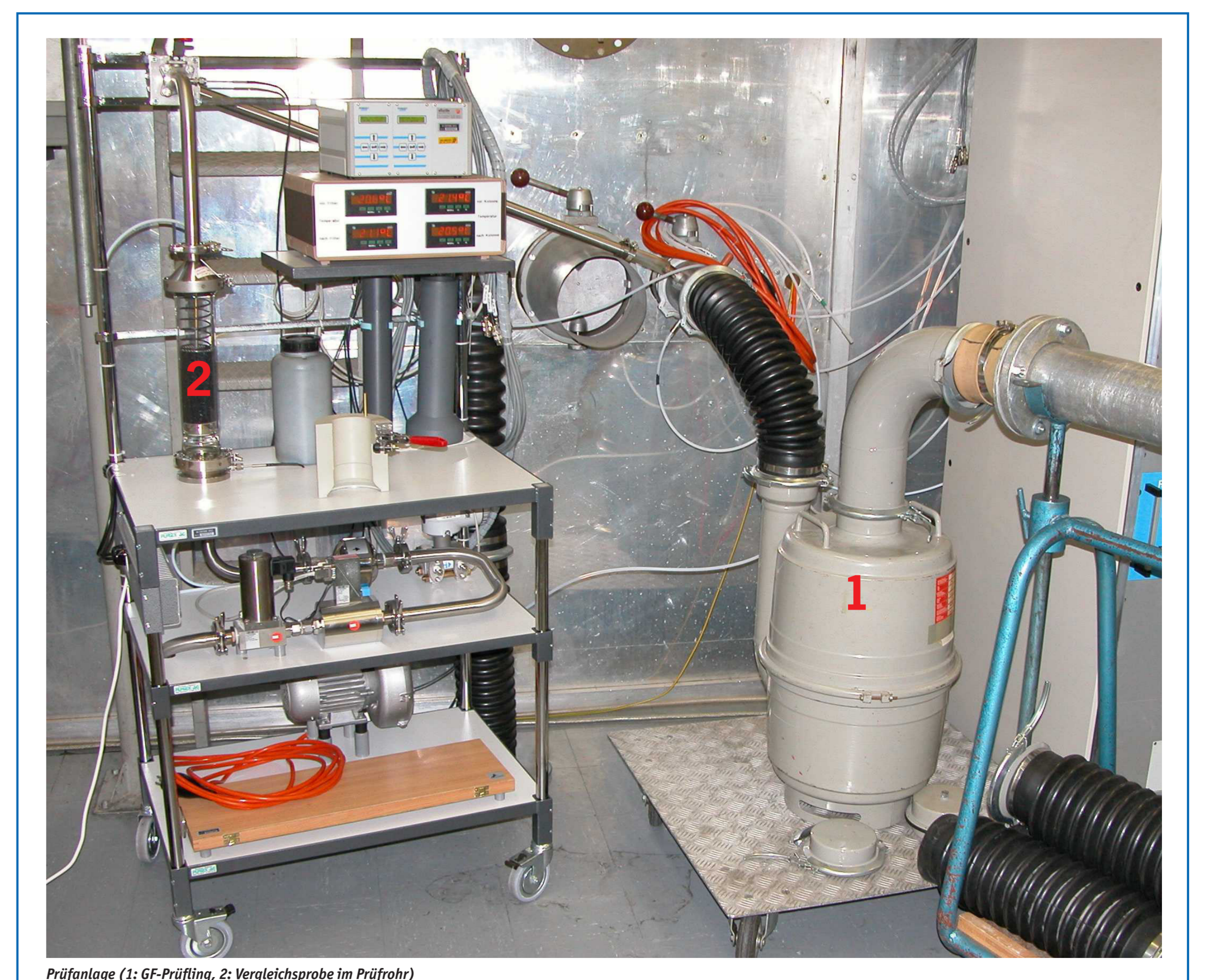
Prüfanlage (1: GF-Prüfung, 2: Vergleichsprobe im Prüfmassstab)