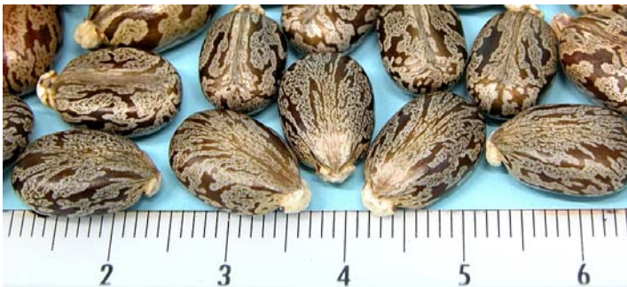
Samenkerne von Ricinus communis

Die Samen des Ricinus communis enthalten etwa 1-2% eines sehr giftigen Proteins (=Ricin). 1g reines Ricin reicht theoretisch zur Tötung von 1000 Menschen! Die letale Menge kann durchaus durch den Verzehr eines Samens erreicht werden.