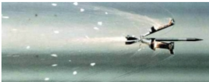
Figur 1: Pfeilmunition kurz nach dem Abschuss, im Moment der Ablösung des Pfeils von seinem Treibspiegel.

In Legierung mit 2% Molybdän oder 0.75% Titan und nach einer speziellen Temperaturbehandlung ist Uran so hart wie gehärteter Werkzeugstahl. Kombiniert mit seiner hohen Dichte ergibt sich ein Material, welches sehr gut zur Herstellung von Pfeilmunition geeignet ist.