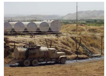
Boden- und Grundwasserbelastung, Ölraffinerie in Mazar-e-Sharif.