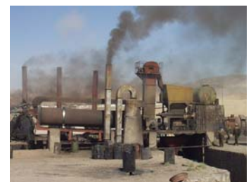
Luftverschmutzung durch Industrieanlagen, Teerfabrik in Herat.