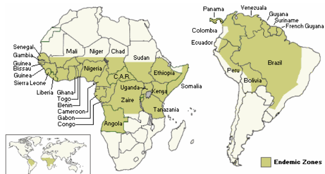
Fig: Les régions endémiques en Afrique et en Amérique du Sud. The Brisbane Travel Doctor Clinic, Brisbane, Australie.

Jusqu'au début du siècle, des flambées de fièvre jaune se produisaient également en Europe et en Amérique du Nord. Selon les statistiques de l'OMS, quelque 200'000 personnes dans le monde contractent chaque année la fièvre jaune, parmi lesquelles environ 30'000 décèdent des suites de l'infection. Par contre, les infections sont rares chez les voyageurs qui doivent se faire vacciner avant de gagner une zone d'endémie.