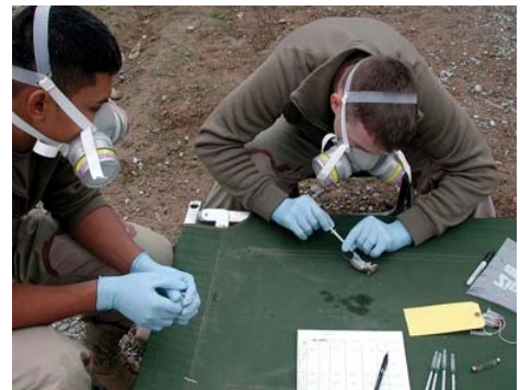
Fig.: U.S. Army Center for Health Promotion and Preventive Medicine

Pour ne pas contracter d'infection HV, il est important d'éviter le contact avec des rongeurs et leurs excréments et de prendre des mesures préventives adéquates. Il convient en premier lieu de lutter contre les infestations de rongeurs dans les appartements, les maisons et leur proche environnement. Aux Etats-Unis, des contrôles sont effectués régulièrement pour vérifier qu'il n'y a pas de HV dans la population des souris.