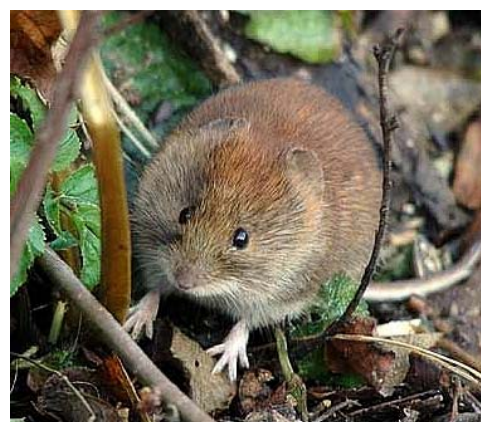
Fig.: Campagnol roussâtre ( Clethrionomys glareolus ), source: www.hlasek.com

L'Occident a découvert les infections HF à la suite de la Guerre de Corée (1950-53), lorsque plus de 3'000 soldats américains développèrent une maladie accompagnée de forte fièvre et d'insuffisance rénale qui fut appelée fièvre hémorragique de Corée. A l'époque, le taux de mortalité était de 10%. Il a fallu attendre plus de 20 ans pour que l'agent pathogène responsable puisse être isolé en 1976 chez le mulot rayé ( Apodemus agrarius ). Quelques années plus tard, des chercheurs finlandais établirent une parenté entre le virus HF et un virus isolé chez le campagnol roussâtre ( Clethrionomys glareolus ) qui provoque chez l'homme une néphropathie (maladie du rein) épidémique. Bien que les symptômes soient très semblables à ceux de la fièvre hémorragique de Corée, il se produit rarement des hémorragies et le taux de mortalité est de seulement 0,2%.