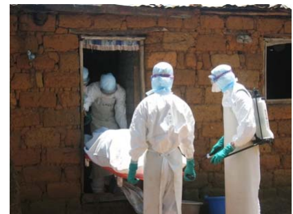
Province de Uige, Angola, 2005

On ne dispose ni de vaccins, ni de médicaments spécifiques contre les infections dues à des virus Marburg. De récentes expérimentations de vaccinations à base de capsides virales fabriquées artificiellement ont donné des résultats très prometteurs chez les rongeurs et chez les primates. La ribavirine, analogue antiviral de nucléoside, est administrée durant les premiers jours suivant l'infection, comme dans le cas des infections à virus Ebola. Cette vaccination connaît toutefois un succès très limité. Le traitement complémentaire consiste en soins intensifs généraux. Pour éviter une transmission du virus, le personnel soignant doit absolument prendre des mesures d'autoprotection.