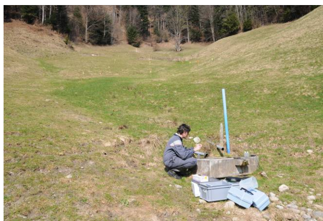
Investigation à un point de captage d'eau