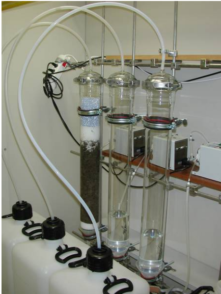
Analyse de la solubilité des métaux lourds

Les analyses ont été effectuées par un service d'essai STS 101 accrédité du LABORATOIRE DE SPIEZ à l'aide d'un équipement de pointe. La mobilité des métaux lourds a été obtenue au moyen d'un essai de lixiviation sur colonne comme le prévoit l'ordonnance sur les sites contaminés. On a procédé à l'analyse des métaux lourds, d'une part, par spectrométrie de fluorescence de rayons X et, d'autre part, pour des éléments spécifiques, par la méthode très sensible de spectrométrie de masse à torche à plasma inductif. Les premiers résultats des analyses sur la distribution et la mobilité du cuivre et du tungstène dans l'environnement sont maintenant disponibles.