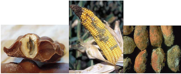
Abb. 2: Befallene Lebensmittel (v.l.n.r. Haselnuss in Schokolade, Mais und Erdnüsse).

Der Befall mit den aflatoxigenen Pilzen erfolgt meistens vor der Ernte, sodass ein Teil der Aflatoxine bereits bei der Ernte in den Samen bzw. Früchten enthalten ist.